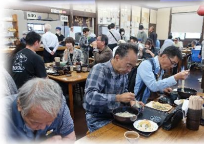
ひがえ りよこう 日帰り旅行 かがわ in香川