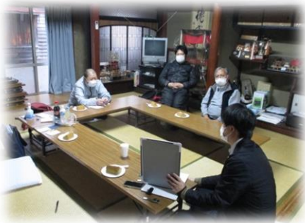
*打ち合わせの様子

デイケアの方達からは「動画で意外と分かり易かった」と感想がありました。他にはその日の作業はどう決まるのか、工賃はいくら貰えるのか、送迎はして貰えるのかなど質問があり、興味を持って頂けたと感じます。